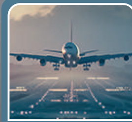
HAVAALANI PİST AYDINLATMA KABLOLARI