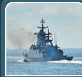
SAVUNMA SANAYİ KABLOLARI